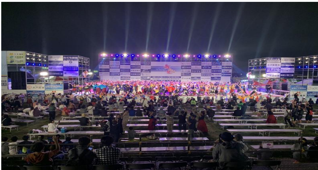
※H31 メインステージ（夜）