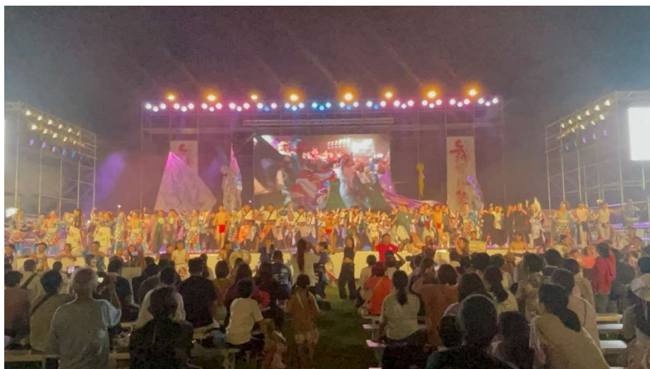
※R5 メインステージ（夜）